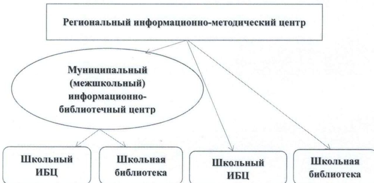
Рис. 3 Модель 3.

Модель 3. Последняя, смешанная модель (Рис. 3), подразумевает наличие в территории собственного муниципального центра, но, в то же время, не ограничивает выход отдельных ШИБЦ непосредственно на РИМЦ по отдельным вопросам и направлениям.